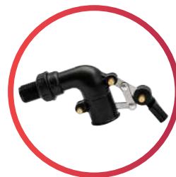
Válvula de llenado de 1/2"