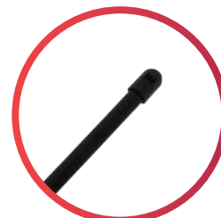
Jarro libera aire de 1/2"x141 cm de alto