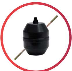
Flotador #5 con varilla