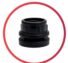
Brida de 1 1/2"