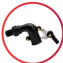
Válvula de llenado de 1/2"