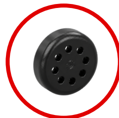
Válvula de aire