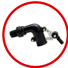
Válvula de llenado de 1/2"