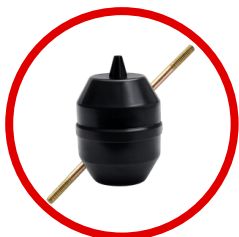
Flotador #5 con varilla