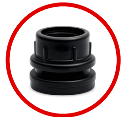
Brida de 1 1/2"